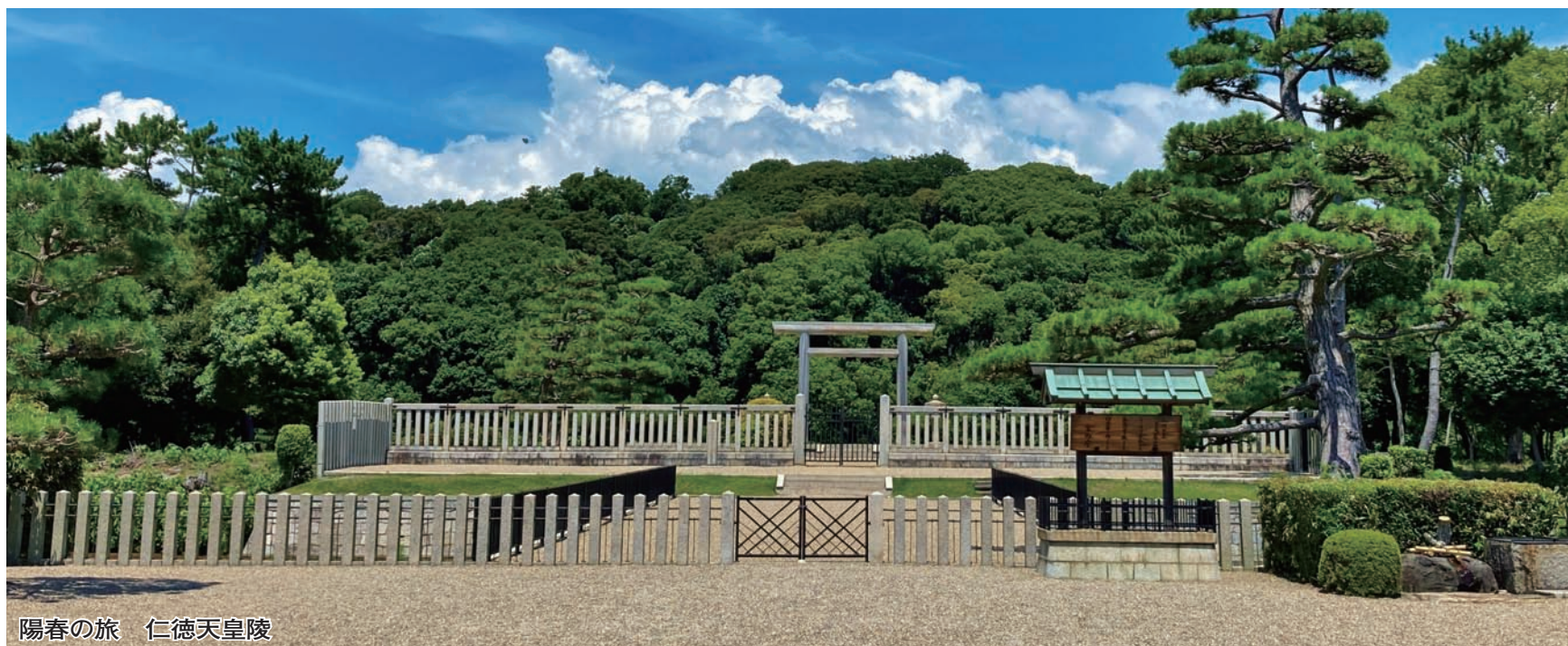
陽春の旅 仁徳天皇陵