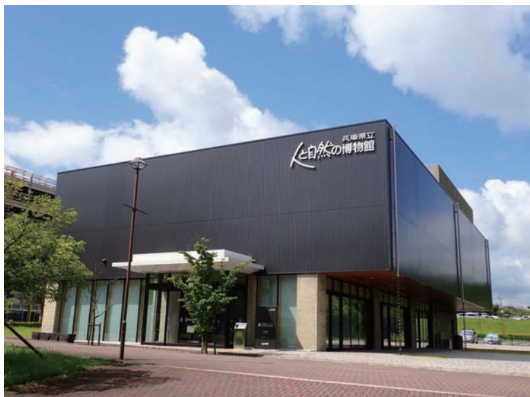
人と自然の博物館

次に、堺市にある大仙公園へ向かった。ここには、世界遺産に登録された『仁徳天皇陵古墳』が隣接し、堺市百舌鳥(もず)にある、古代日本の最大の墳墓として有名な名所で、うやうやしく、多くの方が手を合わせ、頭を垂れ、残念ながら柵内には入れなかった。