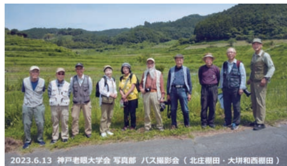
2023.6.13 神戸老眼大学会 写真部 八咫撮影会 (北庄棚田・大井和西棚田)

当部では、毎月撮影会を開催しており、その年内3回はバスをチャーターしております。6月の撮影会は岡山県の北庄と大井和西の棚田を撮影に行きました。場所柄道幅が狭くマイクローバス利用となりました。地元住民の手作りによる色々な案山子が風景に馴染むようにセッティングされており楽しく撮影することが出来ました。