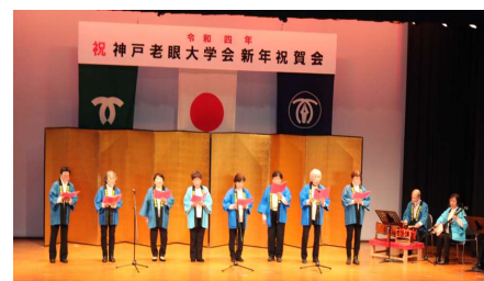
新年祝賀会出演風景