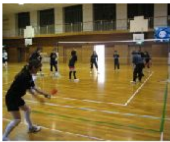
競技は1チーム 4人で試合を行います

後半にはチームを組んで交代をしながら試合をどんどん行いました。チームの中で声掛けやうまくレシーブ・トス・アタックの三段構成で相手コートに決めることができるとチーム全員で喜び、チームワークのスポーツで簡単に楽しめるインディアカの楽しさの一端に触れることができました。