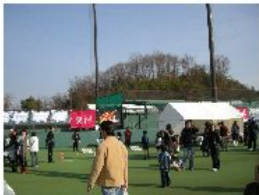
北区ロードレースの様子 スタンドにはクラブフラッグが並べられました。