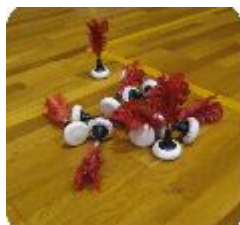
羽の付いた インディアカボール

が、左右どちらかの手のひらでボールを直接打ち返す動作はなかなか出来ないもので、何度もボールに手が届かず空振りをしてしまったり、あらぬ方向へ飛んで行ってしまふこともありました。