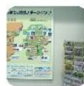
正面玄関西側に コーナーを設けて います。

北側正面玄関より体育館に入った西側に地域スポーツクラブコーナーを設けており、現在各スポーツクラブのパンフレットやお知らせなどを掲示させていただきます。今年度より担当をさせていただきますことにより、このたび大きく変更を行うことが増えたことにより、