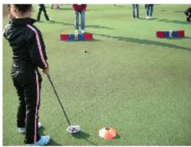
ランチャーの他にローラーと呼ばれるパットの練習用具などもあります。

（ゴルフを始めるために）S N A Gとは、『くつつく』という意味のほかに、ゴルフ未経験者や子供でも最初からボールを打つことができ、コースプレーを楽しめる『ゴルフを始めるために』作られました。また、学校の校庭や体育館のよう