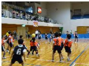
兵庫区ドッジボール交流大会の様子 総勢400名を超える子どもたちが参加しました。

北区の本区・北神地区では『北区ロードレース』に協力し、神戸総合型地域スポーツクラブを知っていただくために、連携推進事業としてニュースポーツを体験できるコーナーなど行いました。