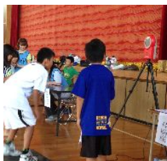
ふれあいフェスタ

4つの地区に分かれて対決しており、熱戦が繰り広げられました。また、中央体育館からの出張サポートとして、準備運動で幻と言われているラジオ体操第3を行わせていただきました。少し複雑な動きに戸惑いながらも皆さん楽しみながら体を動かされています。出張指導をご希望のクラブはご遠慮なく中央体育館までご連絡下さい!