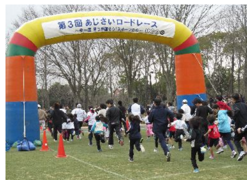
昨年度(第3回大会)の様子

参加申し込みはすでに終了しておりますが、合計で900組を超える申し込みがあり、神戸市内はもちろん、兵庫県下の様々な地域からの申込みも頂いています。たくさんの方の皆様と大会の日を迎えられることを楽しみにしています!