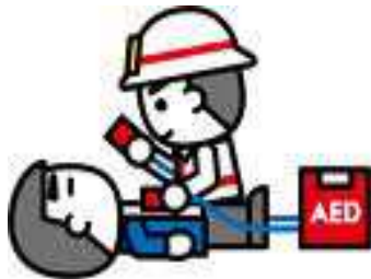
(自動体外式除細動器)