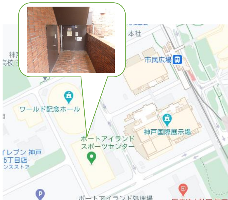
スポーツセンター北東の入口

専用利用の30分前からPSCに入場することができます。休館日は、1階玄関を施錠していますので、下図の当スポーツセンター北東の入口（濃い茶色の鉄扉）から入場をお願いします（廊下の照明が点灯していない場合は、入ってすぐ左に照明のスイッチがあります。廊下中央の照明は常時点灯しています。）。また退出も入場された出入口（緑の鉄扉）から退出をお願いします。