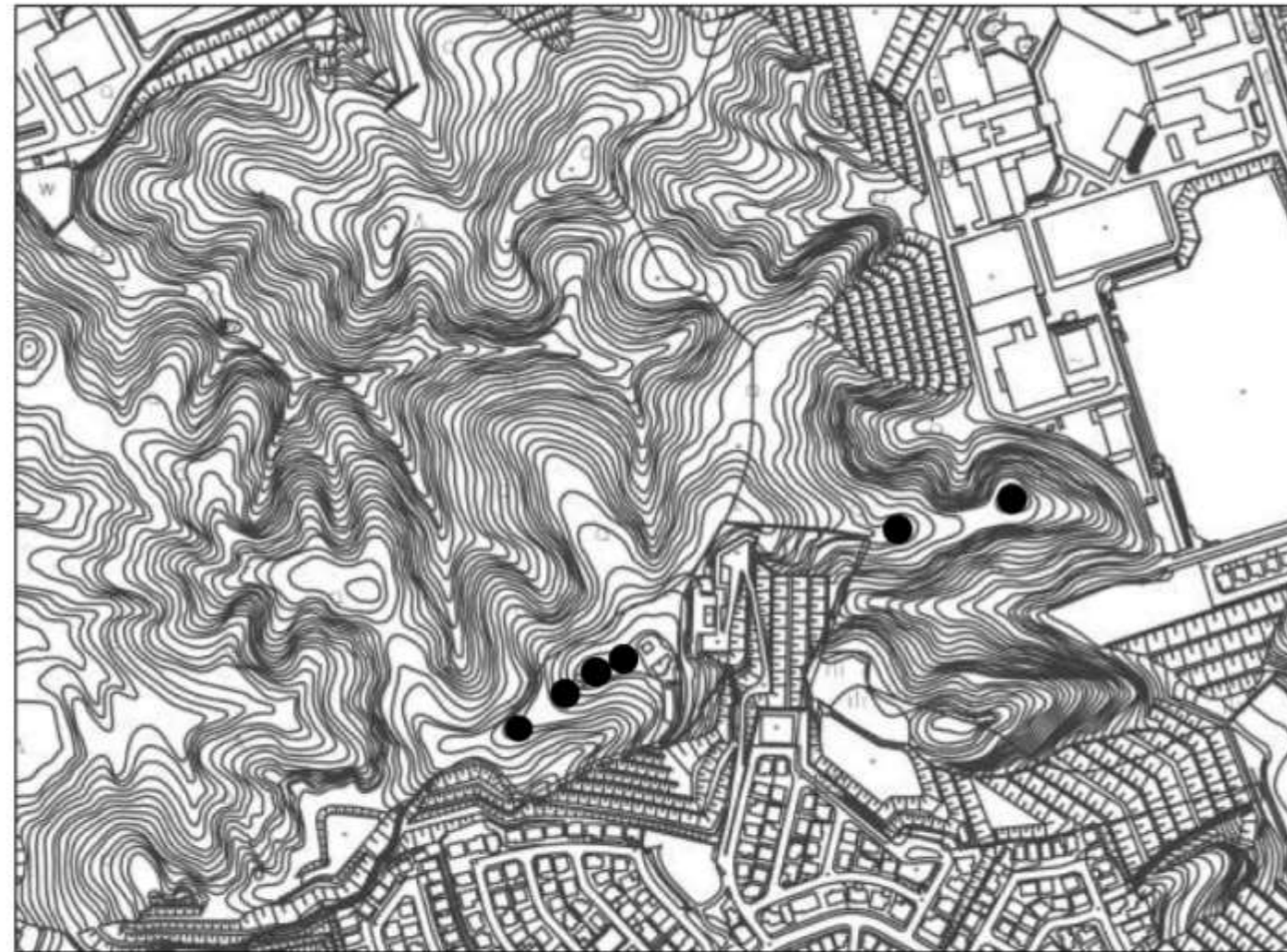
高塚山古墳群の位置図