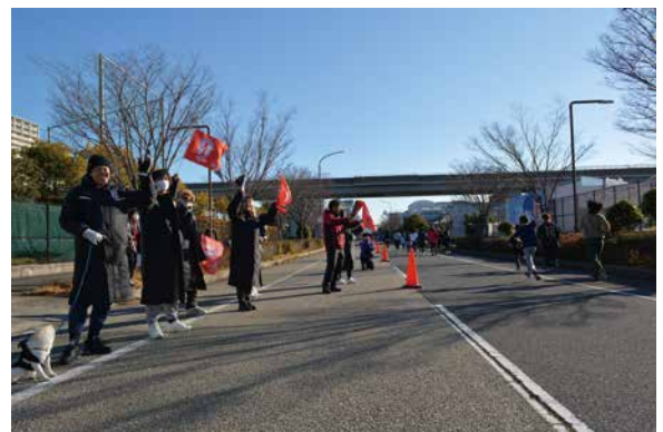
INAC 神戸レオネッサの選手が応援に駆けつけてくれました!