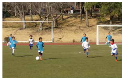
1位 ヴィッセル神戸