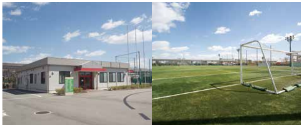
神戸レディースフットボールセンター