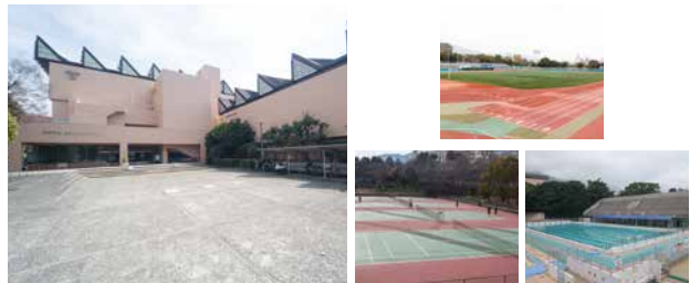
王子スポーツセンター