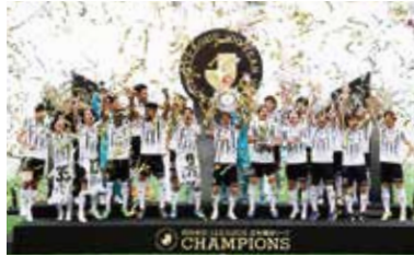
2026 / J1百年構想リーグ優勝